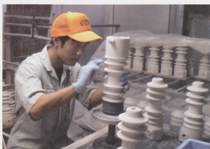
インターンシップ (ヤマキ電器株式会社)