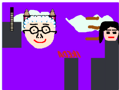
現在制作中のゲーム画面