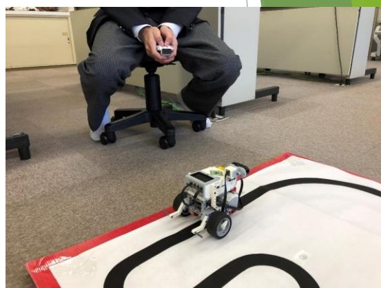
ロボットをリモコンで操作

suduino-bit・Unity・Python等のソフトを使ったゲーム制作も勉強中。